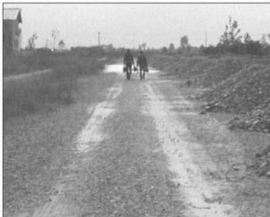
رحیمی معاون آموزشی، آقای دکتر رنجبر معاون پژوهشی و